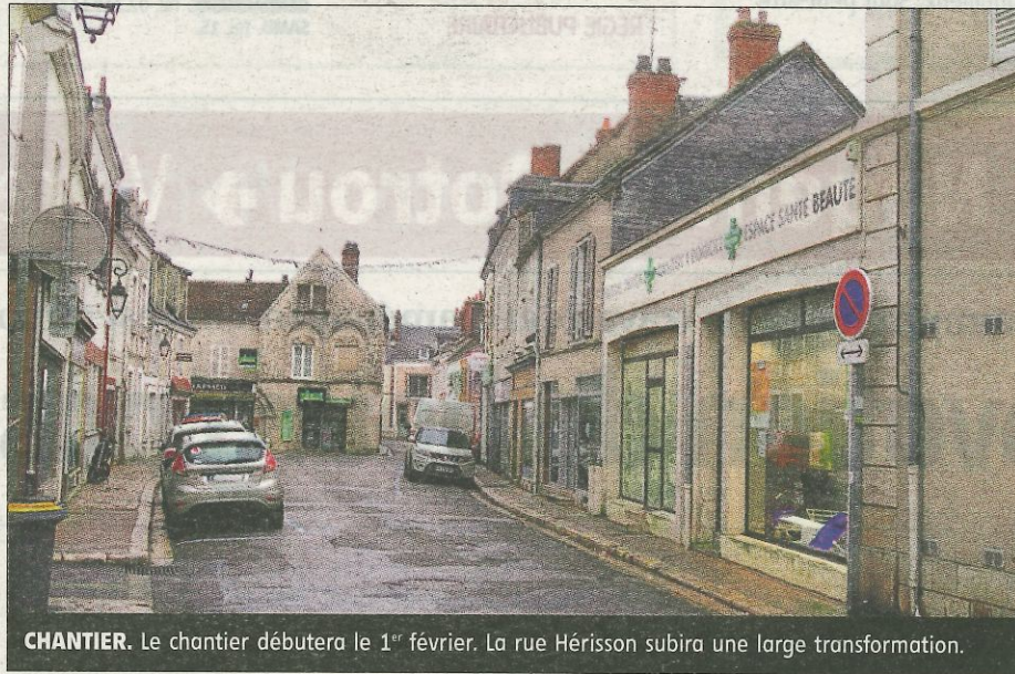
CHANTIER. Le chantier débutera le 1 er février. La rue Hérisson subira une large transformation.